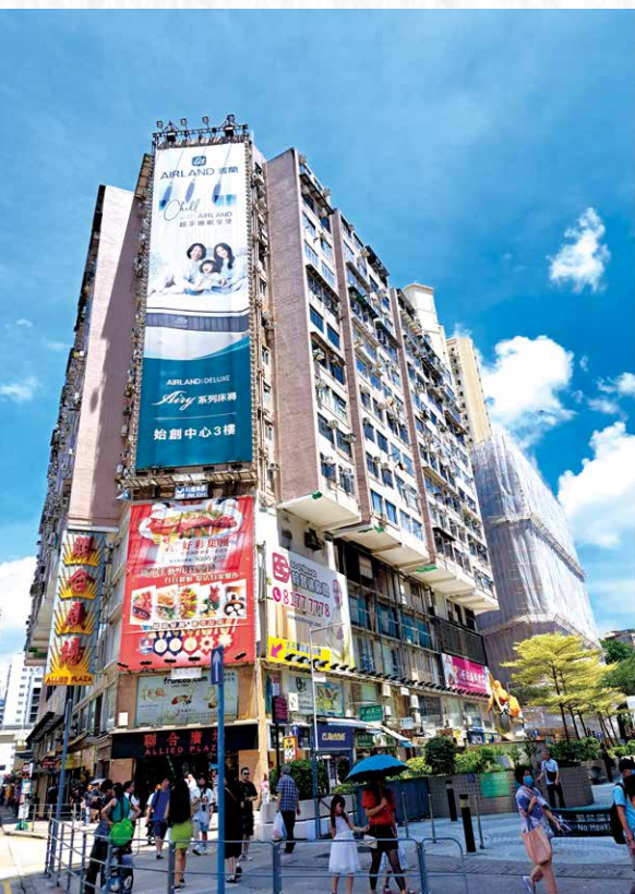
◆ 1957 年在東樂戲院演《蝶影紅梨記》。東樂位於現東海大廈 / 聯合廣場 / 彌敦道水渠道交界。

的唐寅根本是一個不折不扣的登徒浪子，當街調戲良家婦女的色狼，家中有九個老婆，還色眯眯地努力搞婚外情、追秋香，是離經叛道、為害社會的人渣，任姐竟能