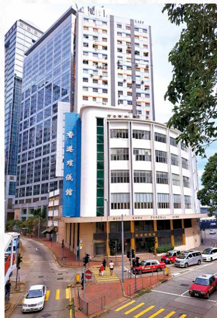
◆任劍輝出殯的鰂魚涌香港殯儀館。