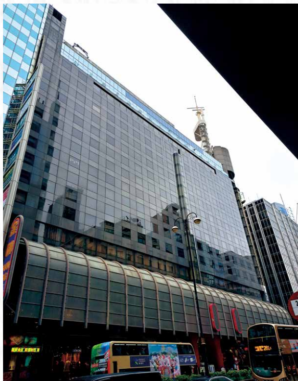
◆李小龍童年家住佐敦彌敦道228號 Katherine Building，現重建為恒豐酒店。