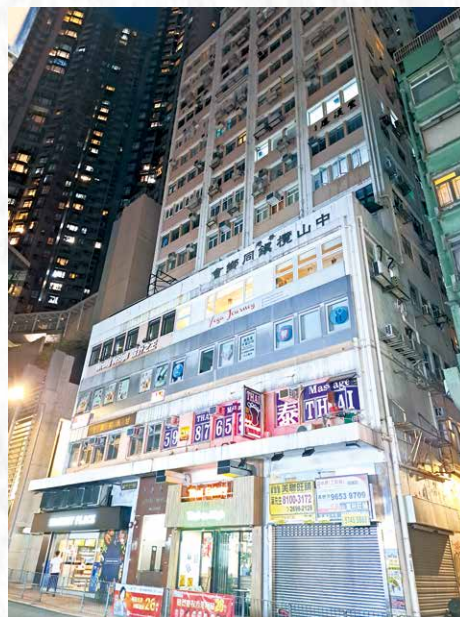
◆ 皇后大道中 270-276 號中央戲院，現為中央大廈。1945 年任姐在此上演《紅樓夢》。