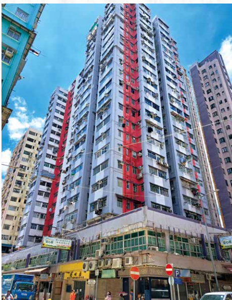
◆油麻地廣東道與碧街交界的金華大廈前身為金華戲院，開幕由任劍輝剪綵。

生命譜上永恒傳奇。幾十年後的今天，你還會聽到在卡拉OK有人唱「暮月夜抱泣落紅，險些破碎了燈釵夢」《紫釵記》的一段，又或《帝女花》。天呀！任白好似從未離開過我們似的，沒有人會說任白的歌落伍。唐的詞優雅，係殿堂文學級數，他將任白的演出昇華到藝術和文學的天花高度。這全因為任姐的嚴謹要求，認真製作，才找到唐滌生這類高手作拍檔。因為任劍輝，才有這一套又一套的傳世之作，粵劇迷應該感謝她。